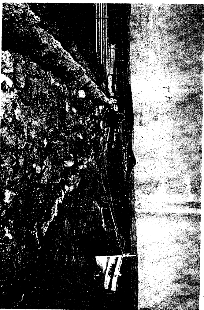
● La jetée dont quelques centimètres seulement affleurent et la Catalane à bord de laquelle œuvrent les plongeurs